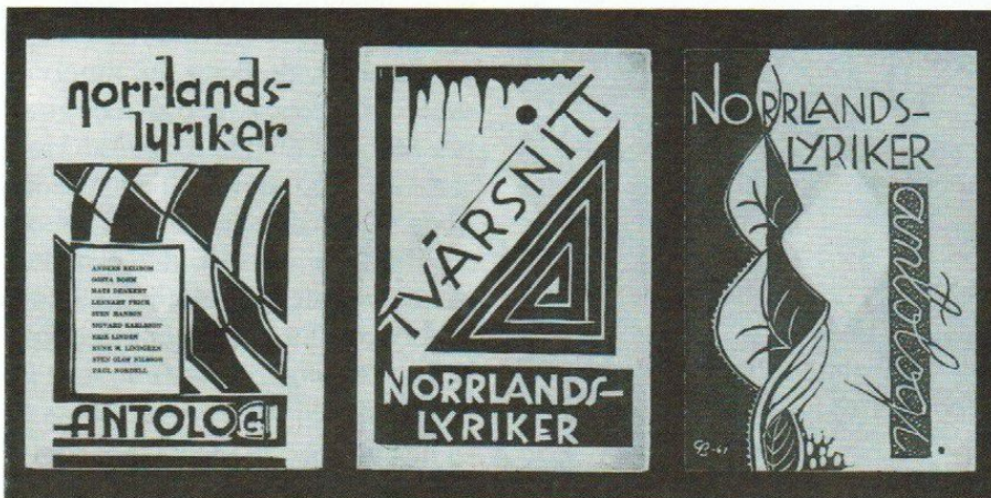
Tre lyrikantologier utgavs av Grupp Provins 1958-1961.