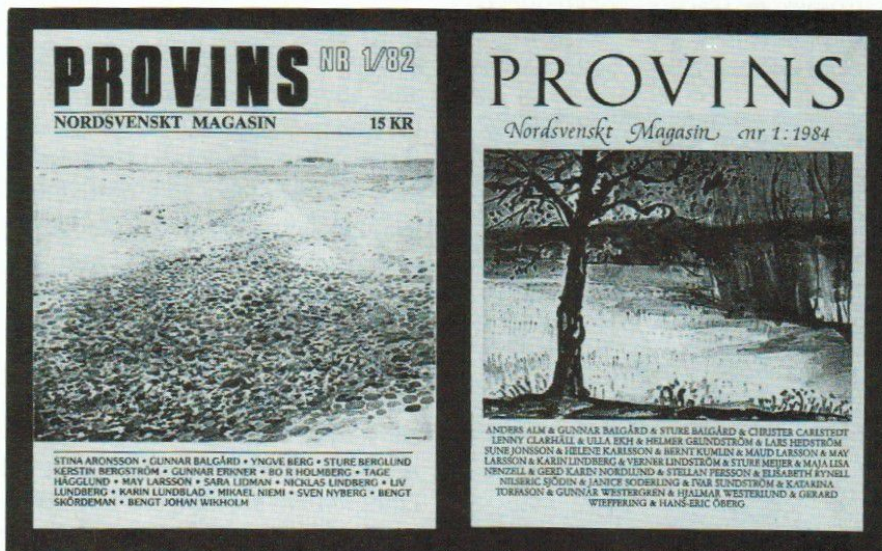
Nya Provins' utseende vid starten 1982 (t v) och fr o m 1984 (t h).

Under tre styrelsemöten i Sandviken, Resele och Luleå under det kommande året tar planerna på tid-